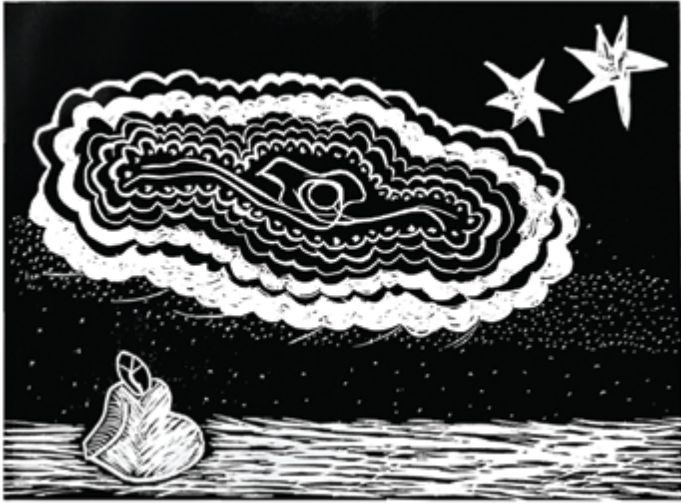
María, llena eres de gracia