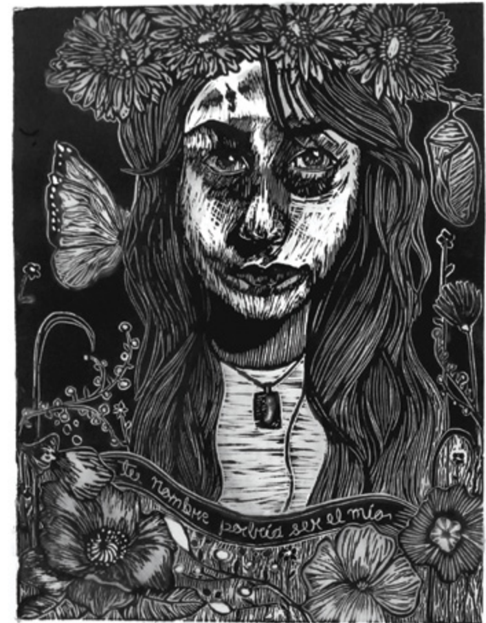
Te traje flores, mi amor