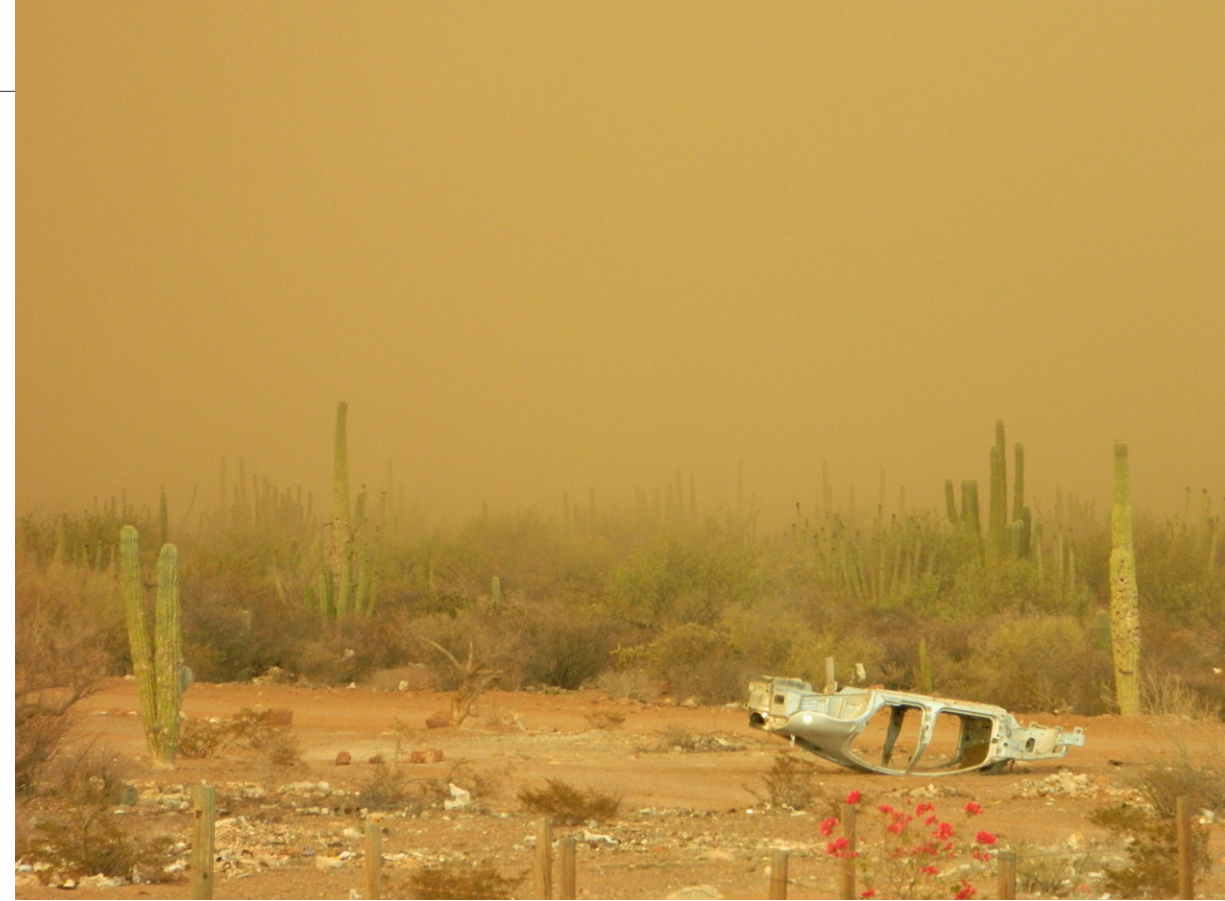
Tormenta de arena. Punta Chueca, Sonora, 2012. Autor: Jesús Ogarrio Huitrón.

Ejemplos como lo son el caso del peyote del pueblo Wirarríka y la Ayahuasca de los pueblos del Amazonas, pueden ayudar a comprender la complejidad de este tema y la necesidad de abordarlo desde una mirada antropológica que permita trazar un mapa de los procesos de desterritorialización y territorialización, así como de los procesos culturales donde la naturaleza es fetichizada y domesticada en función de un mercado que le pone precio a la naturaleza sagrada de los pueblos originarios. En el caso del Incilius Alvarius sucede un despojo similar al del peyote, ya que dicha especie se encuentra fuera de la legislación territorial de los comcaac , hecho que los saqueadores y recolectores del 5MeO-DMT aprovechan para extraer grandes cantidades de esta sustancia para su comercialización. Pero, por otra parte, aquellos que aplican la sustancia de forma ritual, toman prestado (sin autorización de los cantores y de las autoridades) los cantos y las indumentarias propias de los ajuares tradicionales de los comcaac contemporáneos. No obstante, en medio de tal maraña de significaciones, donde la locura, la muerte y el despojo parecieran emerger ante tales circunstancias,