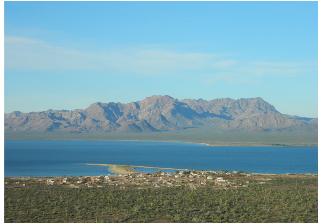
Poblado de Punta Chueca. Enero, 2012. Autor: Jesús Ogarrio Huitrón.

Es muy buscado por personas que viajan desde muy lejos, a veces desde otras partes del mundo; detrás de su imagen hay una figura de conocimientos y sanación a través del arte. No obstante, para mucha gente de la