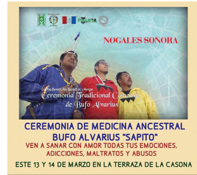
Sapito Shaman Comcaac Nogales. Ceremonia de sanación con sapito Bufo Alvarius (publicado en Facebook).